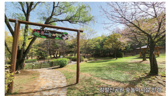
정발산공원 숲놀이시설 전경