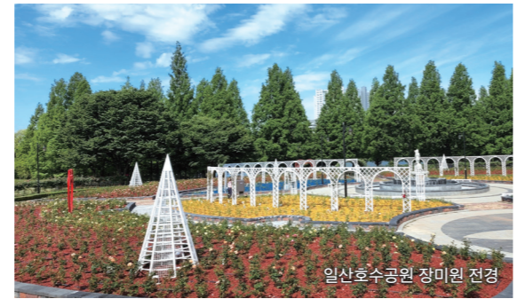
일산호수공원 장미원 전경

이외에도 동산꽃맞이공원 환경개선사업, 일산서구 근린공원 LED 등 교체사업 등 쾌적하고 편안하게 근린공원을 이용할 수 있는 다양한 사업을 추진하고 있다.