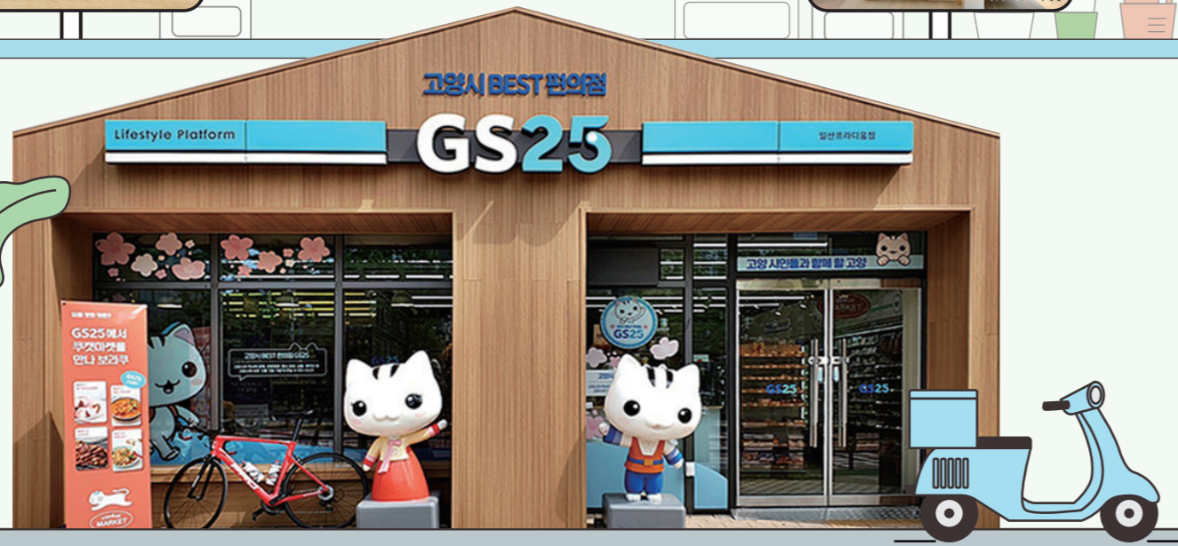
GS25일산프라디움점 일산동구 연리지로 60(장항동)