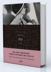
패싱 저자 넬라 라센 | 출판 문학동네 #아무진_세미집순이가 추천합니다

'만약 당신이 남편마저도 모르게 흑인임을 숨기고 살아가는데, 그가 극심한 인종주의자라면 어떻게 할 것인가? 인종차별이라는 상황 앞에서, 동일 인종이지만 다른 삶을 선택해 살고 있는 사람들의 이야기가 우리에게 생각할 거리를 던져준다.'