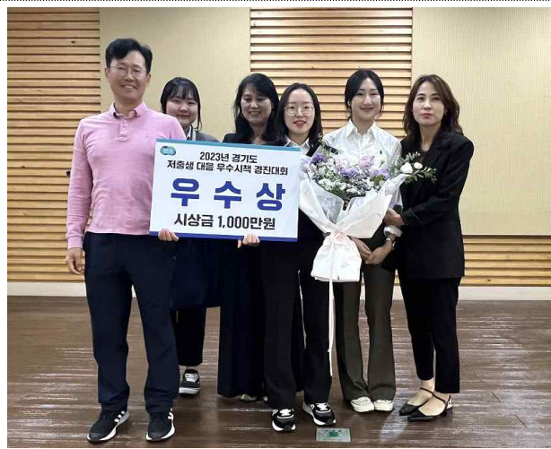
경기도 저출생 대응 우수시책 경진대회 우수상 수상