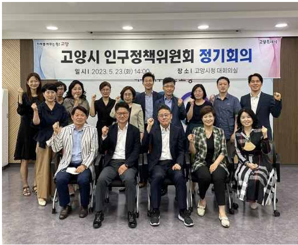
고양시 인구정책위원회 정기회의