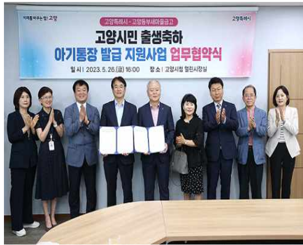
출생축하 아기통장 발급 지원 사업 업무협약식