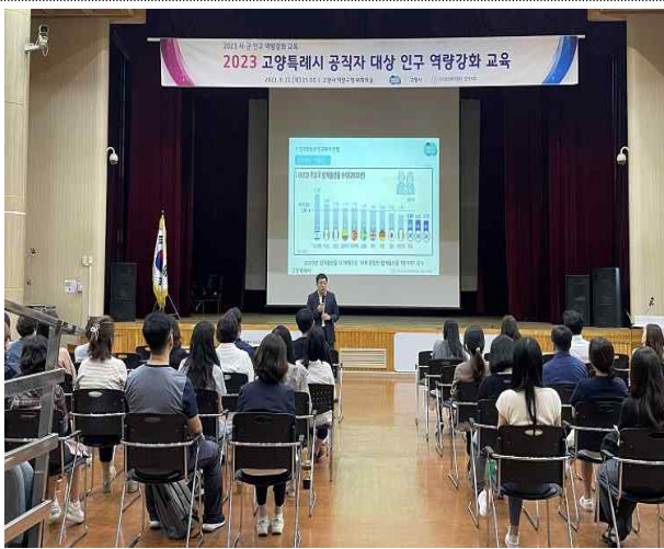
공직자 인구 역량 강화 교육