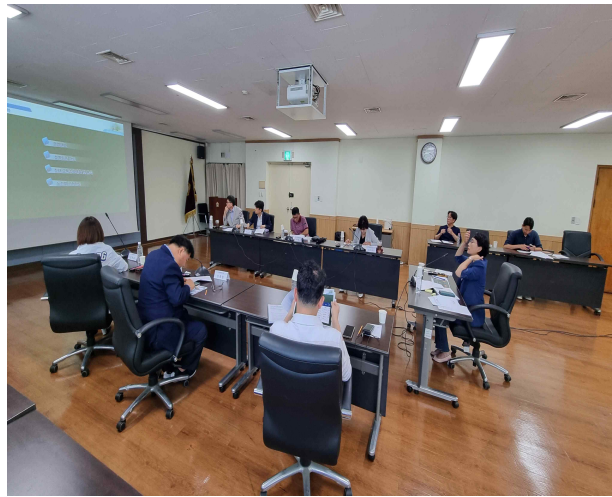
시의회 중간 보고