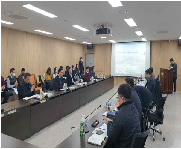
수변특화 용역 착수보고회(전문가 자문포함)