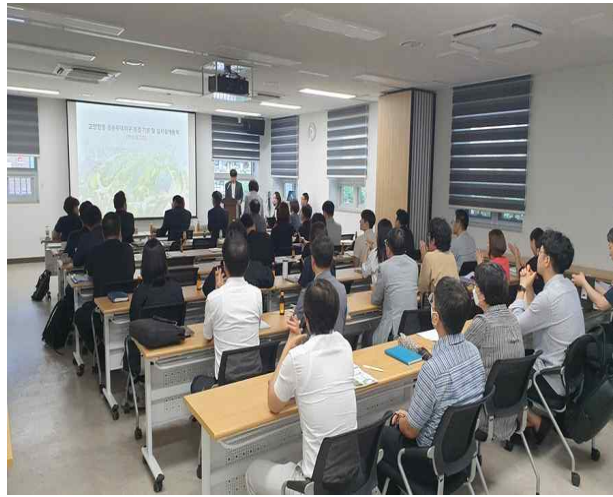
공원녹지 기본 및 실시설계용역 착수보고회 (전문가 자문 포함)