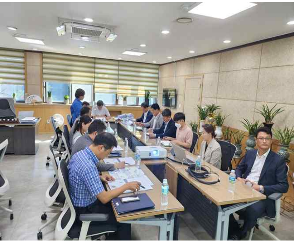
수변특화 및 실시설계 용역 관련부서 회의