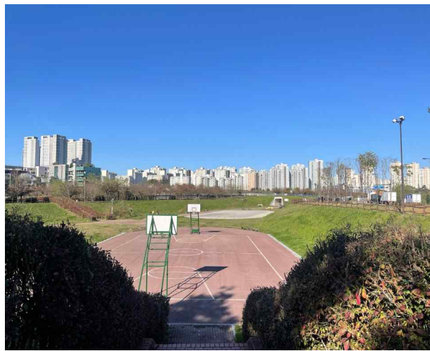
킨텍스 유수지 테니스장 조성공사 공사전