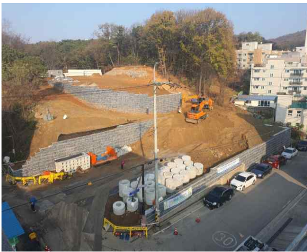
관산근린공원 다목적구장 착공후 대지조성 공사중