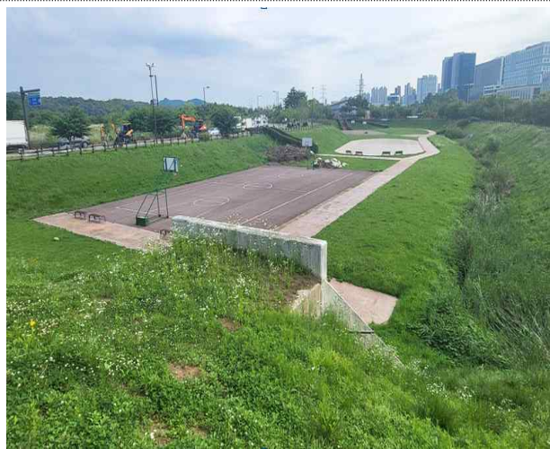
삼송동 유수지 테니스코트 조성 공사전