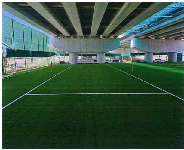
장산IC 하부 체육시설 조성 완료