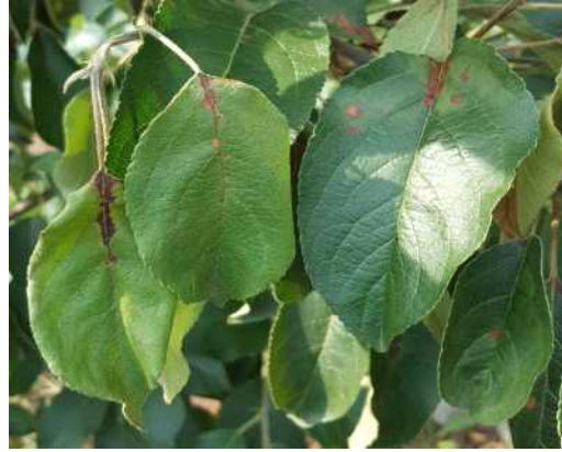
잎자루를 따라 갈변