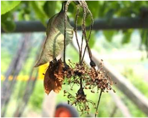
꽃이 검게 변하고 마름