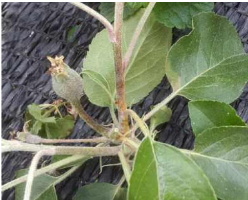
과실 줄기가 갈변으로 세균액 누출