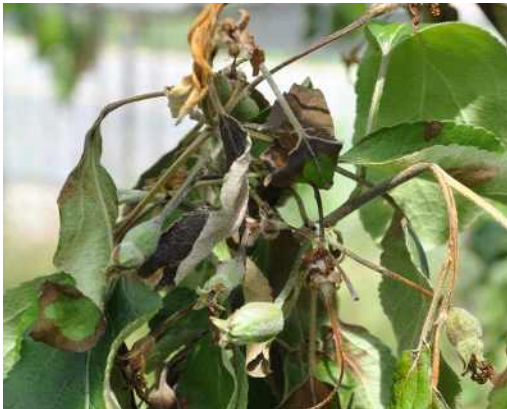
잎 조직이 괴사하고 붉게 마름