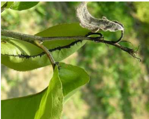
잎 조직이 괴사되며 끝이 갈고리 모양으로 됨