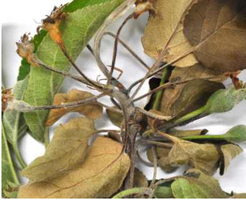
꽃이 갈변하고 세균액 누출 및 마름