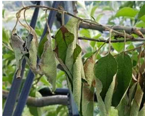
어린 가지가 갈색으로 마르고, 끝이 시들면서 갈고리 모양으로 됨