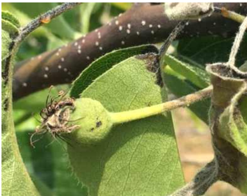
과실 줄기가 갈변으로 세균액 누출