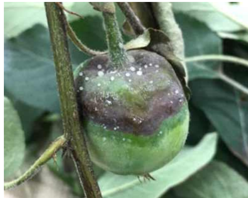
과실이 썩으며 세균액 누출