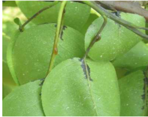
잎자루를 따라 검게 변함