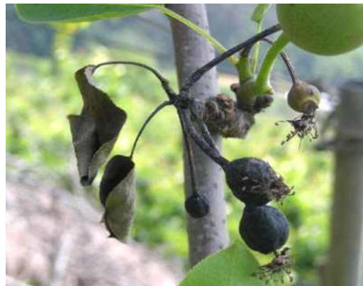
과실이 썩으며 세균액 누출, 검게 마름