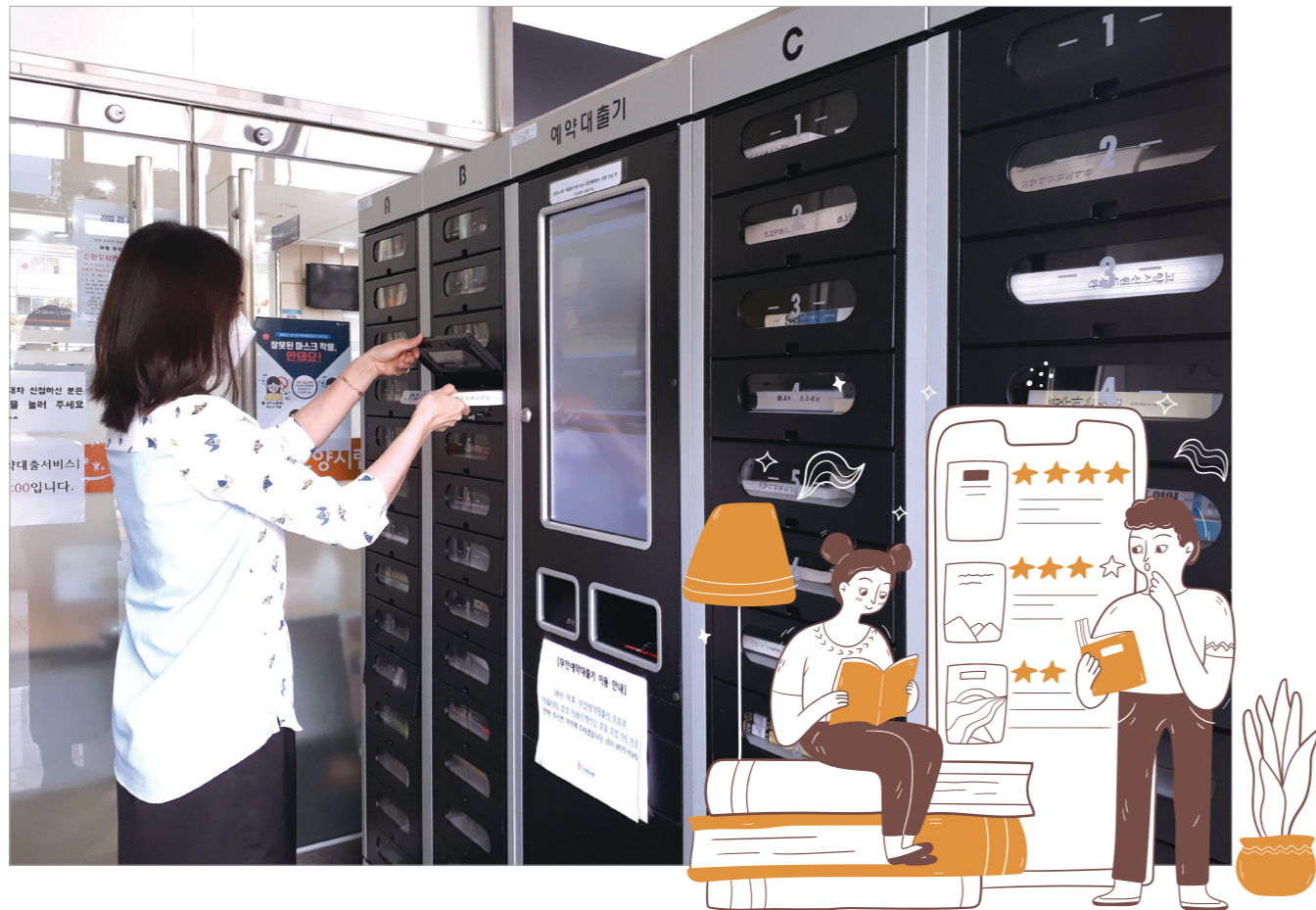
글. 사진. 고양시 도서관센터

코로나19로 도서관 방문 대출이 우려되는 상황에서 고양시 도서관센터는 완벽한 비접촉 도서대출 서비스를 운영하고 있다. 바로 2018년 12월 덕이·마두·식사·신원도서관 및 행신·화정어린이도서관 등 6개 관에 설치한 '무인예약도서대출기'가 그것이다. 이는 홈페이지와 리브로피아를 통해 비치 중인 도서를 예약하면 24시간 어느 때나 책을 대출해주는 무인 대출서비스로, 많은 주민의 호응을 얻고 있다. 올해에는 주엽어린이도서관에도 추가로 설치될 예정이다.