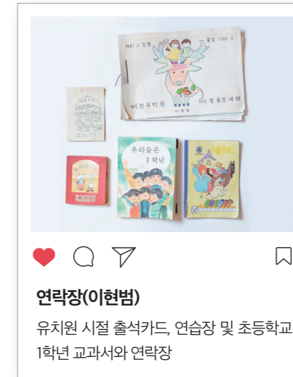
연락장(이현범) 유치원 시절 출석카드, 연습장 및 초등학교 1학년 교과서와 연락장