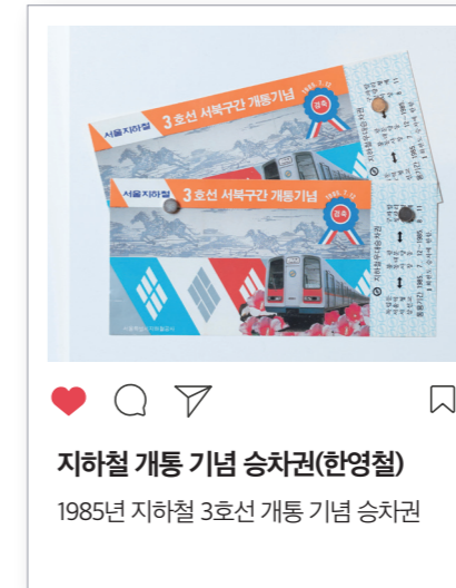
지하철 개통 기념 승차권(한영철) 1985년 지하철 3호선 개통 기념 승차권