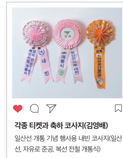
각종 티켓과 축하 코사지(김영배) 일산선 개통 기념 행사용 내빈 코사지(일산 선, 자유로 준공, 복선 전철 개통식)