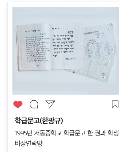
학급문고(한광규) 1995년 저동중학교 학급문고 한 권과 학생 비상연락망