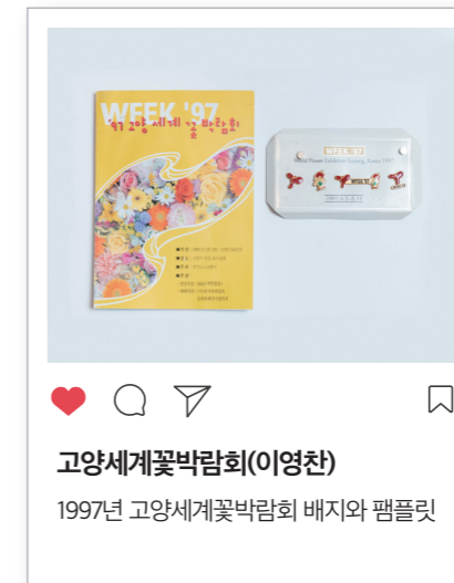
고양세계꽃박람회(이영찬) 1997년 고양세계꽃박람회 배지와 팸플릿