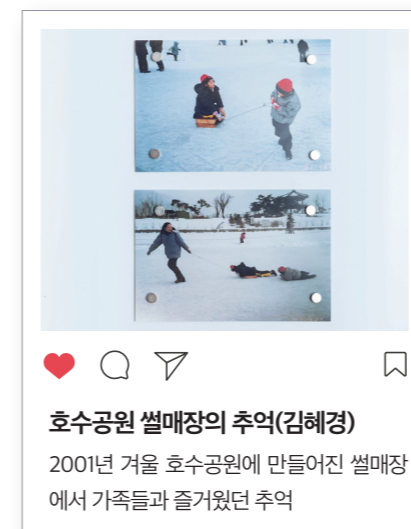
호수공원 썰매장의 추억(김혜경) 2001년 겨울 호수공원에 만들어진 썰매장에서 가족들과 즐거웠던 추억