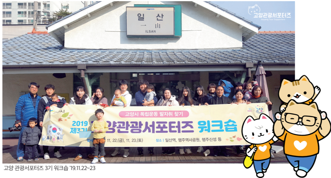
고양 관광서포터즈 3기 워크숍 '19.11.22~23