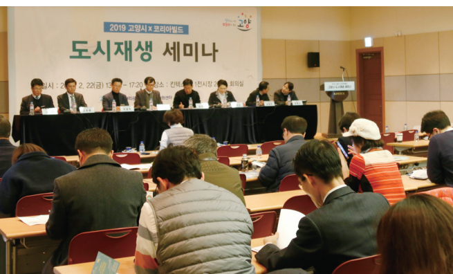
고양시 도시재생 세미나(2월 22일)

이에 따라 '도시재생'과 '기후·환경'의 국내외 전문가들 간 연대를 통해 고양시가 가지고 있는 도시 문제를 국제적 시각에서 전문가들과 함께 해결해 나가기 위한 국제 포럼을 개최하게 됐다. 올해를 시작으로 매년 다양한 분야의 도시문제를 의논할 것이다.